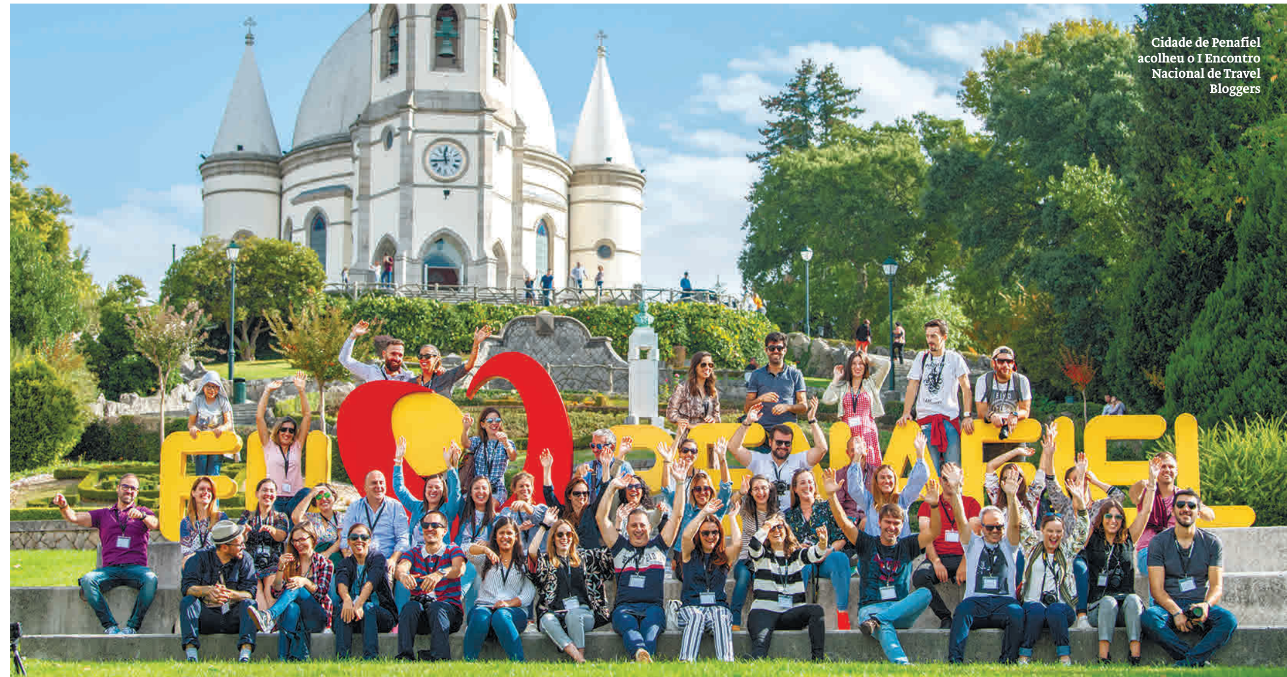
Cidade de Penafiel acolheu o I Encontro Nacional de Travel Bloggers